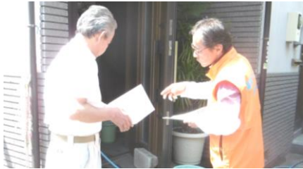
組合員さん宅に訪問し説明をする 小長谷地区長