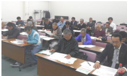
説明を熱心に聞く仲間達