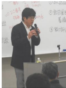
講師の正垣書記次長

技能者に固有の「Cカード」を配布して保有資格や就業履歴などを蓄積し、評価の適正化や処遇改善を図る「建設キャリアアップシステム」がいよいよ動き出します。